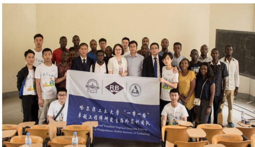
图 1：学院师生出访卢旺达

项、国家重点研发计划项目、“973”计划项目、“863”计划项目、国家科技支撑计划项目、国家自然科学基金项目、国际合作项目、省部级科技项目 300 余项；获国家科技进步二等奖 6 项，省部级科技进步奖 50 余项，作为主要单位参编完成行业及地方规范标准 30 余部；出版专著、教材 80 余部；授权国家发明专利 130 余项；发表学术论文 1500 余篇。